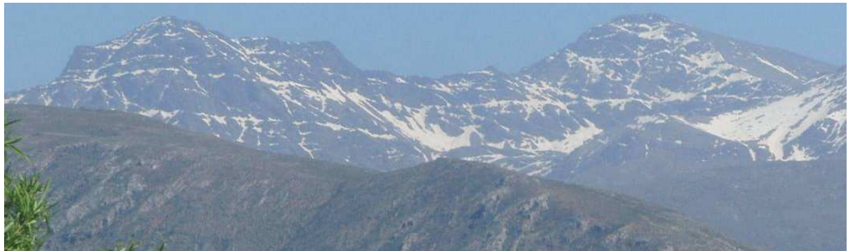
Vertiente norte Alcazaba y Mulhacén 12-5-15