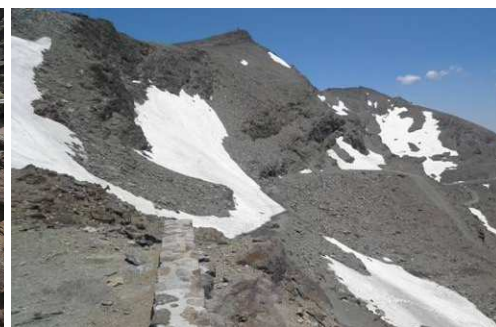
Veredón Superior, Corral del Veleta y Carihuela 30-6-15