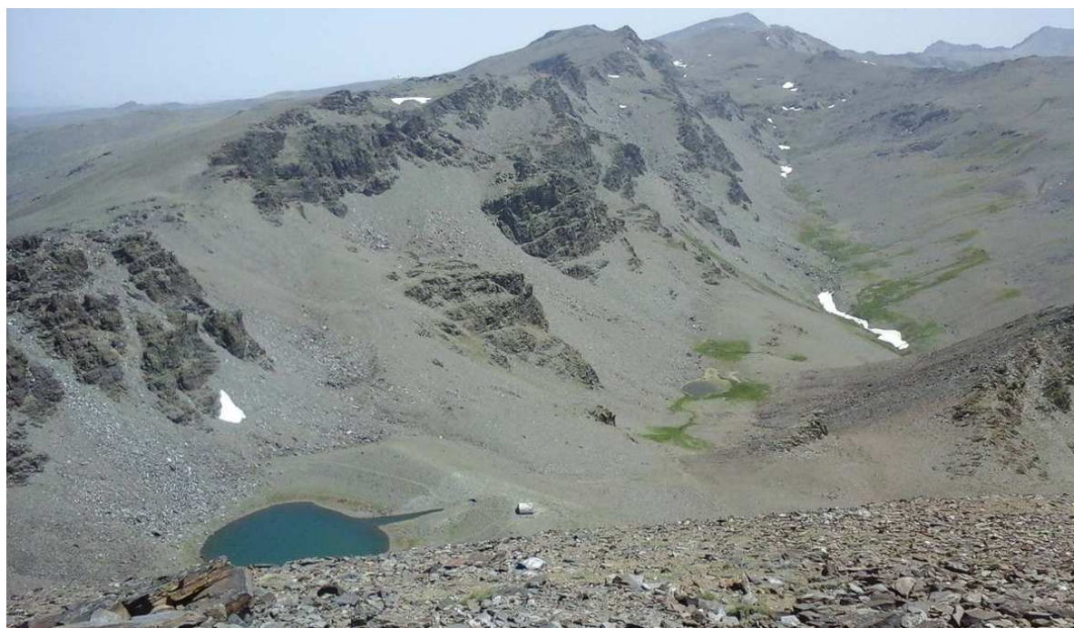
Cabecera del río Lanjarón 1-7-15