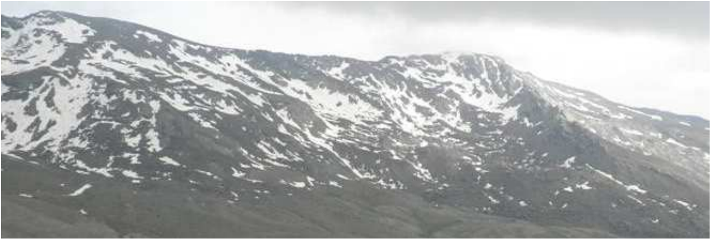
Tajos de la Virgen 26-5-15