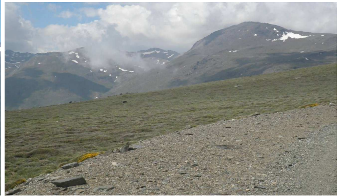
Veleta y Mulhacén cara sur 27-5-15