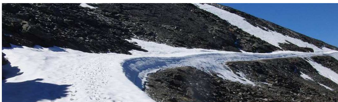
Carretera a partir de las Posiciones del Veleta 2-6-15