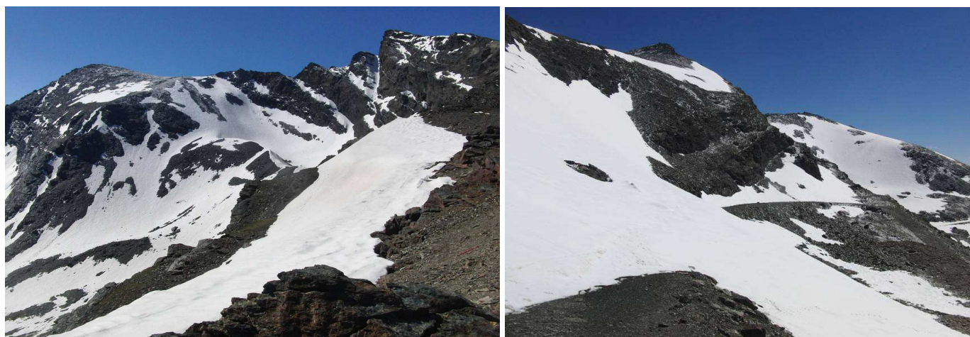
Corral del Veleta y Carihuela 2-6-15