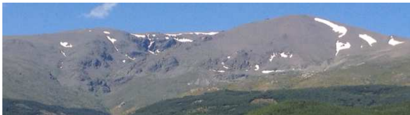
Picón de Jérez 2-6-15